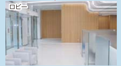
高級感と癒しの空間を演出

また女性に喜ばれる空間として、セルフでお試し頂ける美容器具をご用意した女性専用のセルフエステブースを備えているほか、エステシャンによるエステ体験や美容講習会などのイベントも予定しております。 全面リニューアルオープンまで、引き続き工事を行っており、お客様にはご迷惑をお掛け致しますが、何卒ご理解の程宜しくお願ひ申し上げます。 皆様のご来店を心よりお待ちしております。